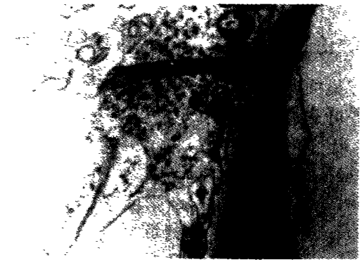
图 3 金瓜显症病叶超薄切片观察

Fig.2 EM observation of sections of C. pepo L. var. ovifera Typical pinwheel-like inclusion bodies (↓) diagnostic of viruses in C. pepo L. var. ovifera (13 500×)